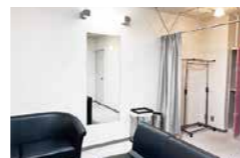
楽屋4(有料楽屋設備)