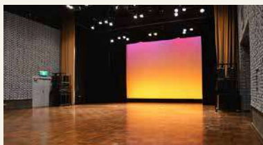
フラット仕様(ロールバックチェア収納)

コンサートはもちろん、ファッションショー、演劇、展示会、吹奏楽の練習など…使い方は多種多様！ また、ロールバックチェア仕様の1階席を全て格納できるので、無料備品の机と椅子を設置することで大きな会議室として使うことも可能です！