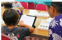
プログラミングワークショップ 「たのしくソウダ」