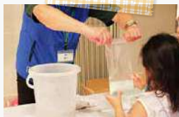
スライムラボ 「おどく光るスライム」