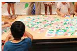
同じ形の図形を敷き詰めをつくる 「デザインセッションデザイン (13ifズル、キンドラーとゴダメエ)」のコーナー