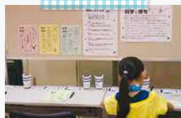
サイエンス用語や 科学用語を使って横断にチャレンジ