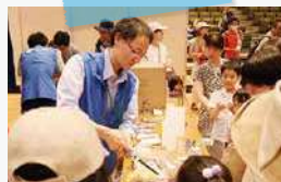
やつちゃんラボ 「いろいろ科学実験たいけん」